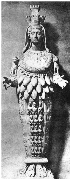
Ilustración II - Diana de los Efesios (Fortaleza)

Esta palabra significa “ fortaleza ”, otros significados pueden ser “ torre ” o “ santuario ”, por tanto cuando el texto menciona que honrará en su lugar al dios Mauzim, en realidad dice al “ dios de las fortalezas ”. Pero esto aún es más profundo, pues el texto nos está llevando al pasado, a cuando Pablo habló de la famosa Diana de los Efesios. Pues a esta diosa, también se le llamaba Diana de las fortalezas o diosa de las fortalezas. Esto concuerda perfectamente con la profecía porque la frase “ al dios de las fortalezas ” también puede ser traducida como “ diosa de las fortalezas ”, así que el texto nos está llevando a recordar esta diosa antigua, pero ¿Qué relación tiene con Mauzim?, simple que cuando vemos la imagen de Diana de los Efesios, y miramos que lleva sobre su cabeza, veremos un sombrero en forma de fortaleza o de torre. Notemos las siguientes imágenes de esta diosa: