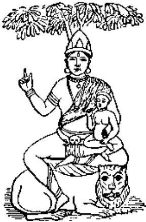
Ilustración VI - Isi e Iswara

También otros dioses de los hindúes eran Isi e Iswara, que son representaciones de Semíramis y Tamuz.