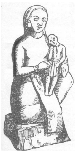
Ilustración III - Semíramis y Tamuz

La historia nos presenta a Semíramis con el bebe Tamuz en brazos amantándolo: