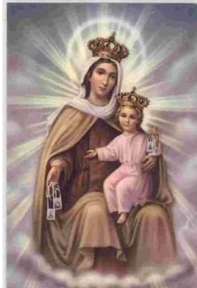
Ilustración VII - Virgen María y el niño Jesús

La tradición dice que Jesús nació un 25 de Diciembre también al igual que otros dioses paganos como Tamuz u Horus, por tanto indica que la adoración como tal o el festejo no se le realiza a Cristo, sino más bien a las deidades falsas que nacieron en este día, pues la Escritura dice que Jesús nació entre Verano y Otoño.