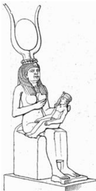
Ilustración IV - Isis y Horus

En Egipto por otra parte a estos personajes paganos se les conocen como los dioses Isis (Semíramis) y Horus (Tamuz), cabe destacar que también Horus nació un 25 de Diciembre.