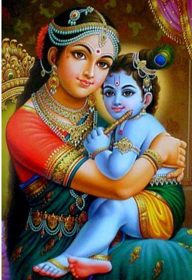
Ilustración V - Indrani y Chitragupta

Estás son deidades hindúes que prácticamente tienen a una madre y a un bebe en los brazos, simbolizando a Semíramis y a su hijo Tamuz.