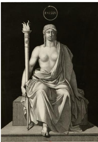
Ilustración I - diosa de la Razón

Así que lo siguiente que hicieron en el mismo año fue destruir la Biblia y perseguir a los cristianos de aquellas épocas: