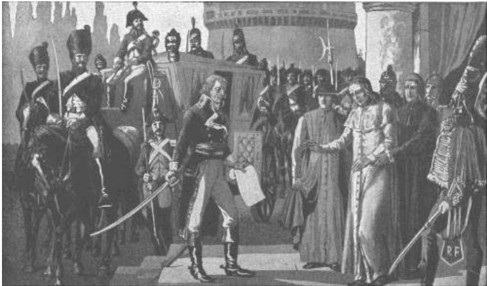
Ilustración II - Papa Pío VI arrestado

Una vez estableciendo quien es el rey del sur, ya podemos saber de qué forma fue el ataque contra el papado. La historia nos dice que Francia al mando de Napoleón Bonaparte envió a su general llamado “ Louis Alexandre Berthier ” o como la historia comúnmente lo llama “ General Berthier ” a Roma. Y las tropas francesas entraron en Roma el 15 de febrero de 1798, precisamente el día en que se cumplía el XXIII aniversario del pontificado de Pío VI. 2