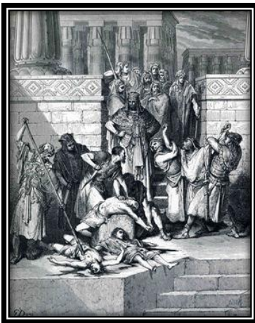
Ilustración 1 - Muerte de los Hijos de Sedequías

14 No escuchéis las palabras de los profetas que os hablan, diciendo: No serviréis al rey de Babilonia; porque os profetizan mentira. 15 Porque yo no los envié, dice Jehová, y ellos profetizan falsamente en mi nombre, para que yo os arroje, y perezcáis, vosotros y los profetas que os profetizan. 16 También a los sacerdotes y a todo este pueblo hablé, diciendo: Así dice Jehová: No escuchéis las palabras de vuestros profetas que os profetizan diciendo: He aquí que los vasos de la casa de Jehová volverán de Babilonia ahora presto. Porque os profetizan mentira. 17 No los escuchéis; servid al rey de Babilonia, y vivid: ¿por qué ha de ser desierta esta ciudad? {JEREMÍAS 27:14-17}