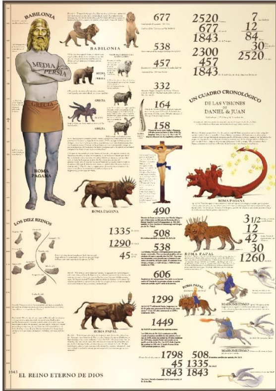
Ilustración 2 - Diagrama de 1843

Finalmente, otro lugar donde encontramos que la interpretación del Continuo que tenían Miller y sus asociados era la correcta y no las que fueron apareciendo después de 1844, son la creación de los dos diagramas en los cuales Dios puso su entera aprobación y guía. Creo que dentro de este ministerio se han mostrado en varias ocasiones estos diagramas: